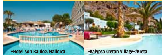
Unsere Test-Reisen: eine Woche Mallorca (links) und zwei Wochen Kreta-Urlaub (rechts)

Bewertet wurden mit den Schulnoten »sehr gut« bis »mangelhaft« die Rubriken Suchen & Sortieren (Testkriterien: 1. Auswahlkriterien/Profisuche, 2. Modifizierungsmöglichkeiten, 3. Sortieren und Filtern), Buchungskomfort (1. Schnelligkeit/Schritte bis zum Buchungsabschluss, 2. Übersichtlichkeit, 3. Userführung, 4. Fehlerkorrektur, 5. Fallstricke), Angebotsbreite (Hotel-/Mietwagenangebot, Auswahl an Flügen und Preisniveau (Reisepreise im Vergleich zu den Wettbewerbern). Die Endnote ergibt sich unter Berücksichtigung der unterschiedlichen Gewichtungen (s. Tabelle) aus den Durchschnittsnoten der Einzelkriterien. Technische Unzulänglichkeiten führten in Einzelfällen zu Abwertungen um eine Note.